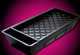
GRO-TANK GT424 | 2-5 PLANTS