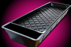
GRO-TANK GT604 | 3-7 PLANTS