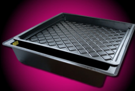
GRO-TANK GT100 | 4-9 PLANTS