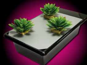
GRO-TANK GT205 | 1-3 PLANTS