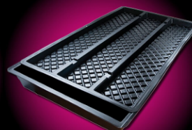
GRO-TANK GT150 | 9-15 PLANTS