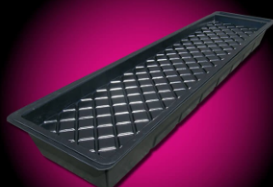
GRO-TANK GT901 | 4-9 PLANTS